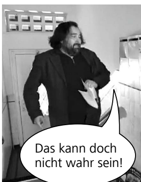
Das kann doch nicht wahr sein!