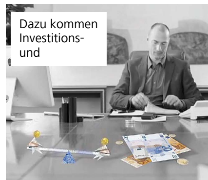
Dazu kommen Investitions- und