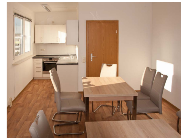
Der helle Gemeinschaftsraum ist für Feiern, gemeinschaftliches Kochen und Spielenachmittage gedacht.