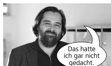
Das hatte ich gar nicht gedacht.