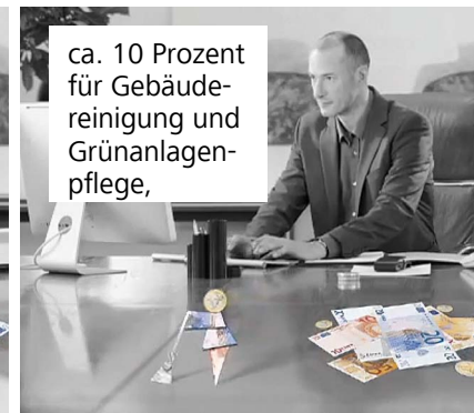
ca. 10 Prozent für Gebäudereinigung und Grünanlagenpflege,