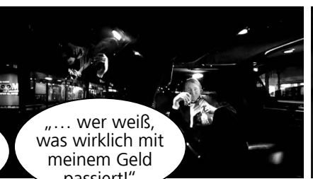
„... wer weiß, was wirklich mit meinem Geld passiert!“