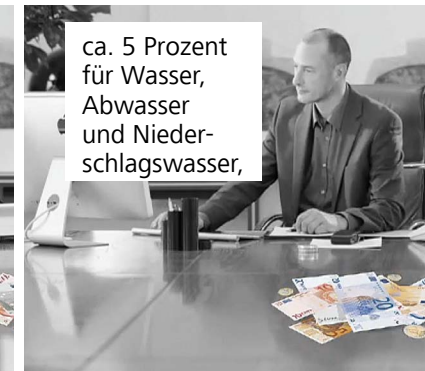
ca. 5 Prozent für Wasser, Abwasser und Niederschlagswasser,