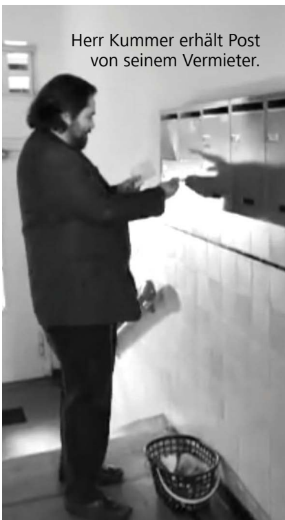
Herr Kummer erhält Post von seinem Vermieter.