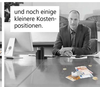
und noch einige kleinere Kostenpositionen.