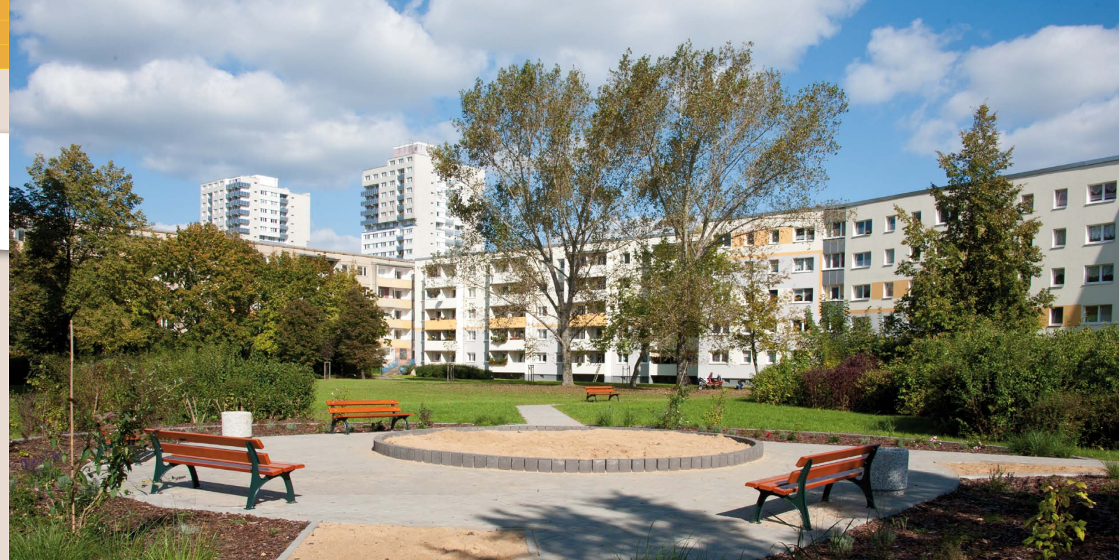
Eine Sanierungsmaßnahme des Jahres wertete das Wohnumfeld am „Göttinger Bogen“ auf.