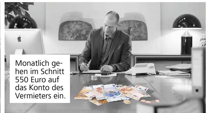
Monatlich gehen im Schnitt 550 Euro auf das Konto des Vermieters ein.