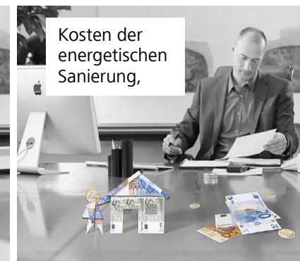
Kosten der energetischen Sanierung,