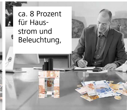
ca. 8 Prozent für Hausstrom und Beleuchtung,