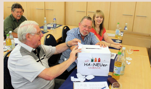
Per Stimmzettel wählen die Mitglieder den neuen Aufsichtsrat.

B8/14: Die Mitgliedervertreter beschließen gem. § 36 Abs. 1 g) der Satzung die Wahl der Aufsichtsratsmitglieder.