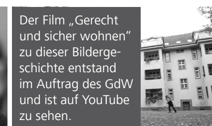
Der Film „Gerecht und sicher wohnen“ zu dieser Bilder-geschichte entstand im Auftrag des GdW und ist auf YouTube zu sehen.