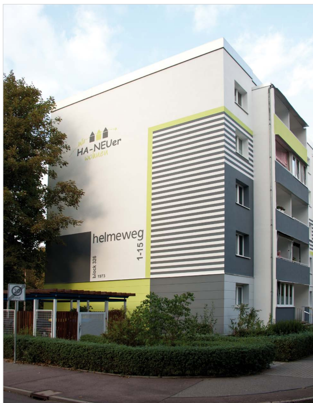
Seitdem die Baugerüste gefallen sind, erstahlt das Objekt „Helmweg 1-15“ in neuem Glanz.