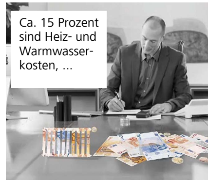
Ca. 15 Prozent sind Heiz- und Warmwasserkosten, ...