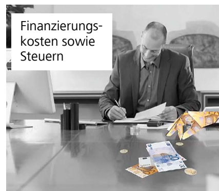
Finanzierungskosten sowie Steuern