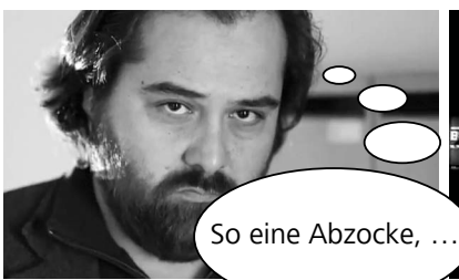
So eine Abzocke, ...