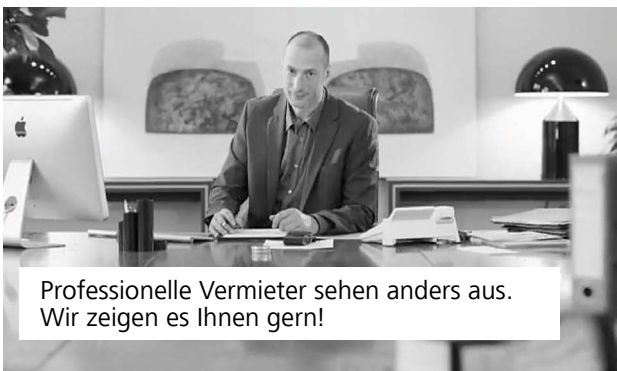
Professionelle Vermieter sehen anders aus. Wir zeigen es Ihnen gern!