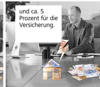
und ca. 5 Prozent für die Versicherung.