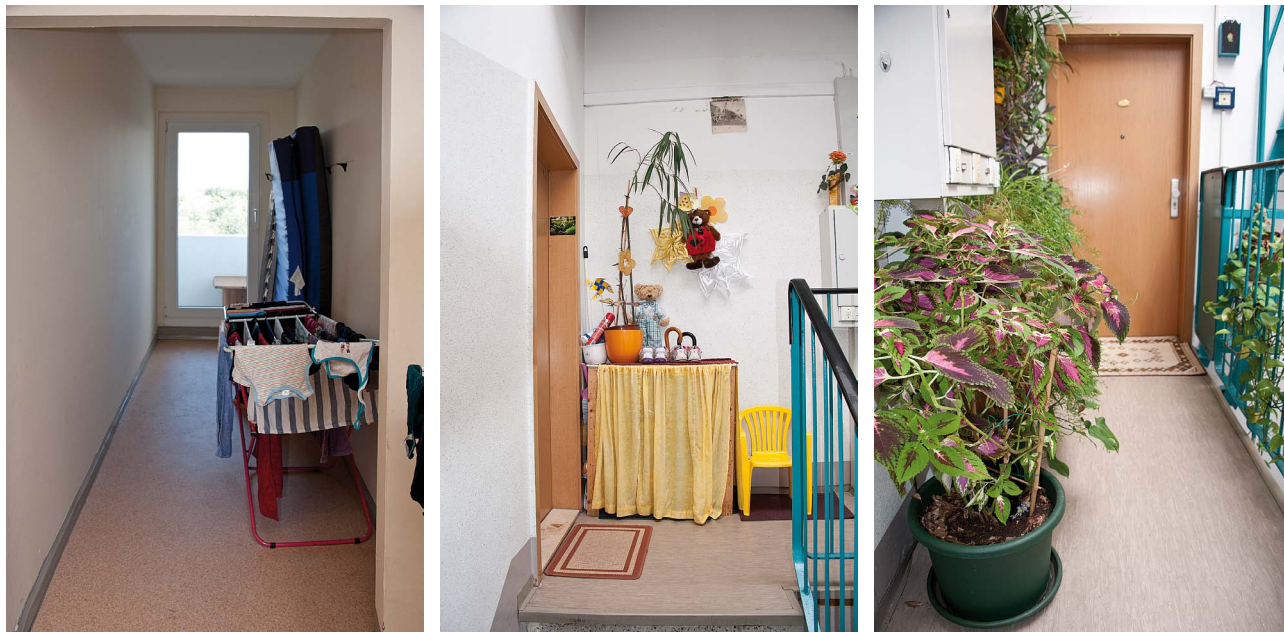
Die Redaktion des „Mitgliedermagazins“ war in einigen Quartieren auf Fotojagd. Wenn der Zugang zu einem Rettungsbalkon in dieser Art zugestellt wird, kann es zu erheblichen Behinderungen kommen, wenn der Aufgang verqualmt ist und die dann aufgeregten Mieter aus dem Objekt fliehen müssen. Oder wenn Sanitäter einen Menschen auf einer Trage schnellstmöglich ins nächste Krankenhaus bringen müssen. Hier geht Sicherheit in jedem Fall vor dekorativer Raffinesse!