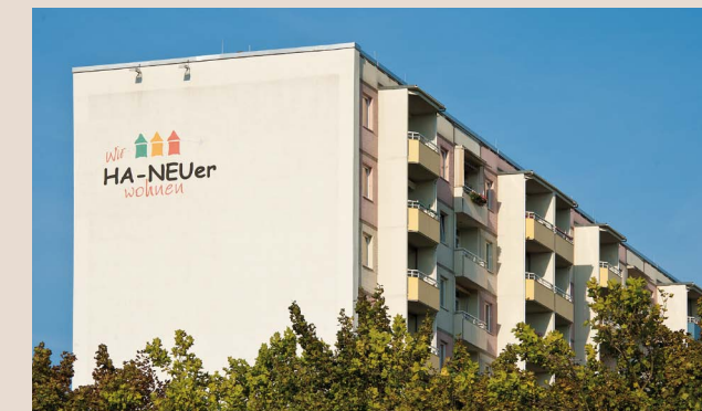
Die Genossenschaft bewirtschaftet insgesamt 36 Objekte.