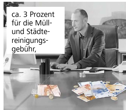
ca. 3 Prozent für die Müll- und Städtereinigungsgebühr,