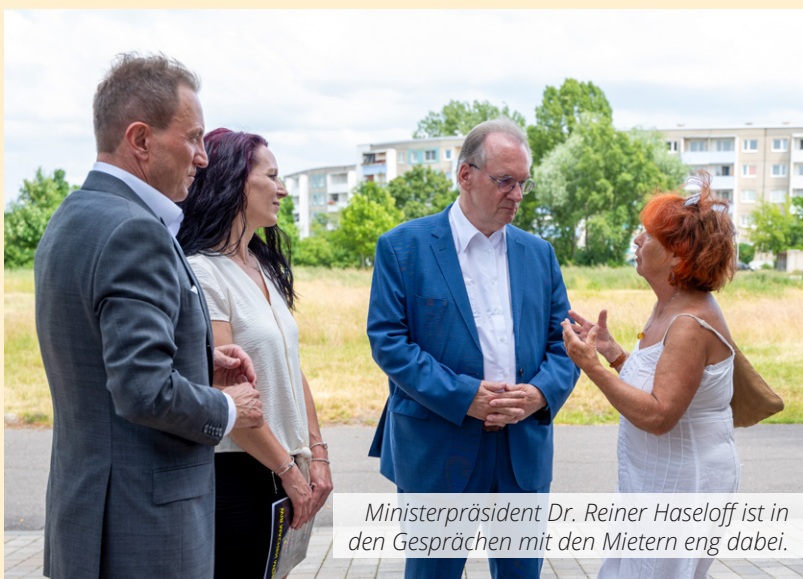
Ministerpräsident Dr. Reiner Haseloff ist in den Gesprächen mit den Mietern eng dabei.

Wir gehen diesen Weg weiter, im Sinne unserer Gemeinschaft, für unsere Familien, unsere Freunde, für Alt und Jung.