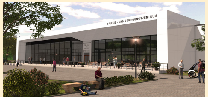
Das neue Stadtteilzentrum zur Zeit im Bau

Das Stadtteilzentrum am Niedersachsenplatz 1 wird nächstes Jahr fertig und bietet in Verbindung mit den Freiflächen im gesamten 6. WK, welche die Stadt Halle gemeinsam mit uns entwickelt, Möglichkeiten des Zusammenkommens, gemeinsamer Erlebnisse, gemeinsamer Gedankenaustausche aber auch die Möglichkeit gemeinsam zu tanzen, zu singen, zu essen, Sport zu treiben, um sich neu zu verbinden.